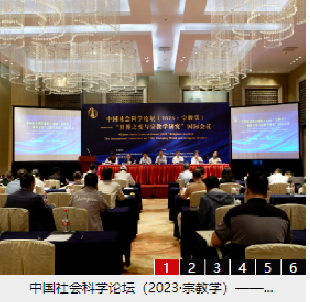
中国社会科学论坛(2023宗教学) ——...