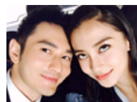
与晓明合影翻白眼