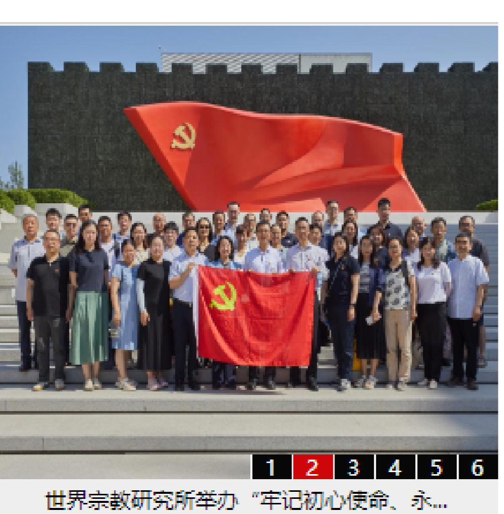
世界宗教研究所举办“牢记初心使命、永...