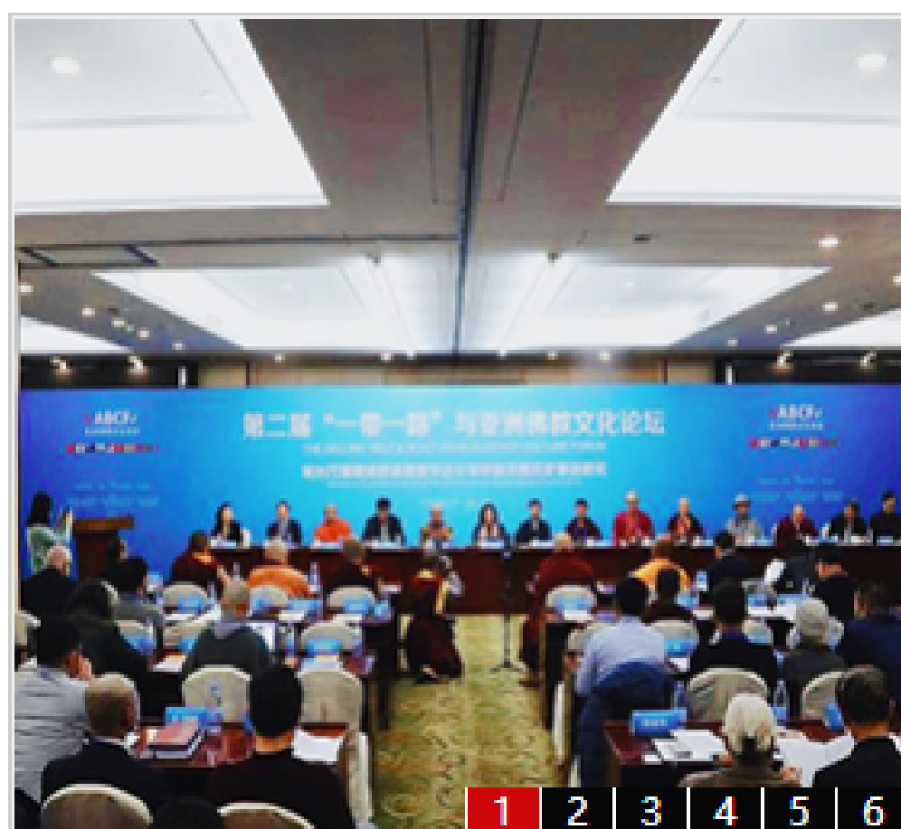
第二届“一带一路与亚洲佛教文化论坛”...