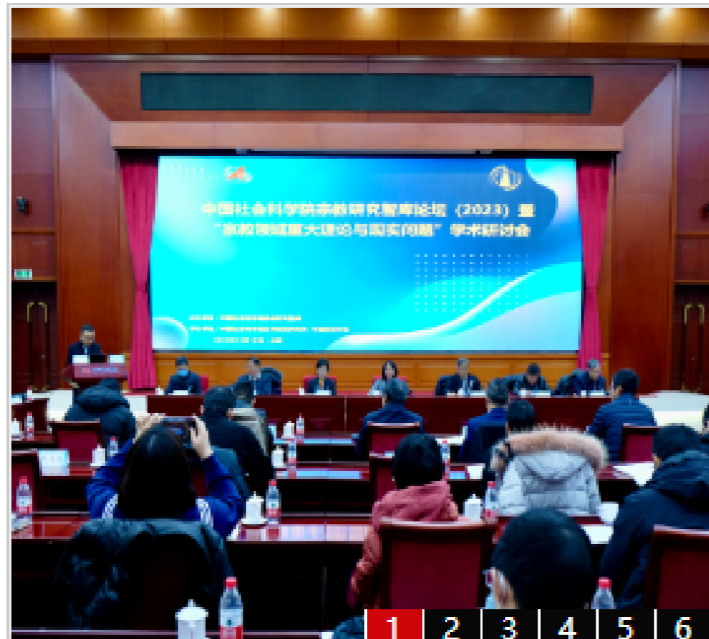
中国社会科学院宗教研究智库论坛(2023)...