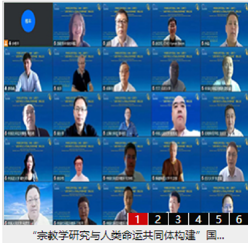
“宗教学研究与人命命运共同体构建”国...