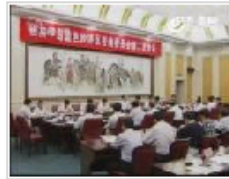
山东半岛蓝色经济区咨询委员会第二次会议召...