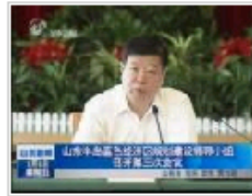
山东半岛蓝色经济区规划建设领导小组召开第...