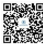
经济管理学院 微信公众号

北京交通大学经济管理学院 School of Economics and Management ,Beijing Jia