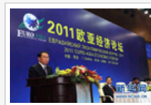
李长春出席欧亚经济论坛