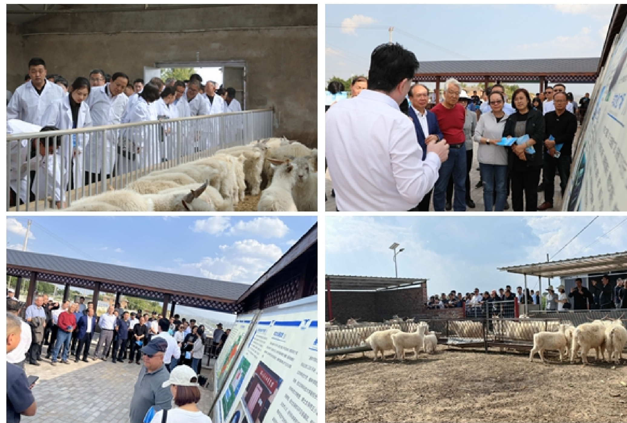
走访调研并开展科技服务