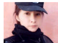
新疆美女民警走红