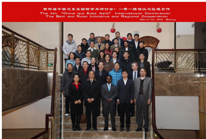
(第四届“中国与东亚”国际学术研讨会合影)

中国政法大学“中国与东亚”国际学术研讨会迄今已连续举办四届，每届均邀请国内外知名专家和青年学者就当下中国与东亚区域热点问题进行讨论，为相关专家学者搭建了观点共享、成果交流、学术联系的平台，拓展了区域研究的新议题、新视角、新方法。