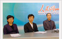
中纪委官员等从崇文区廉 政风险防范管理看我国反 腐预防形势