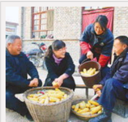
大学生投身新农村建设