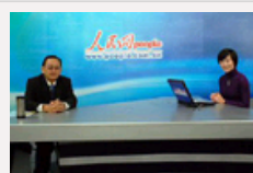
石仲泉深情缅怀毛泽东 评说主席的历史功绩