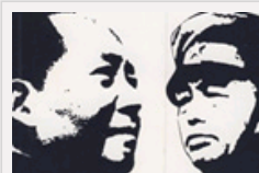
图书连载：《毛泽东与彭德怀》