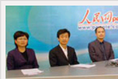
中纪委官员等从崇文区廉政风险防范管理看我国反腐预防形势