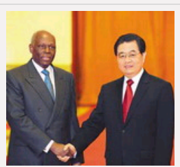
胡锦涛与安哥拉总统会谈