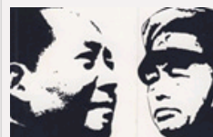
图书连载：《毛泽东与彭德怀》