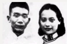
风雨茅庐几多情：郁达夫 与王映霞最终劳燕分飞