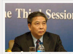
朱振中再批不正之风：别到退休的时候才敢讲话