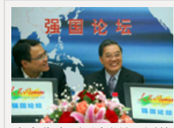
李金华直面网友疑问 回答“政协说话是否管用”