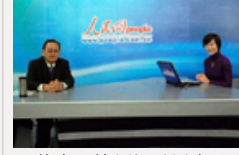
石仲泉深情缅怀毛泽东 评 说主席的历史功绩