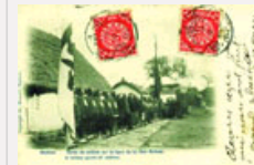
早期的铁路护卫队