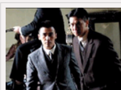
张家辉柳云龙加盟《建党伟业》