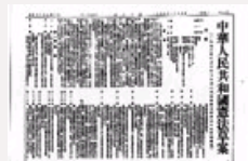
新中国国家主席制度变迁