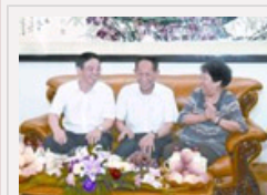
周强笑称袁隆平是“80后”杂交水稻之父迎80大寿