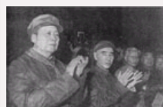
林彪为何不让祝他身体“永远健康”？