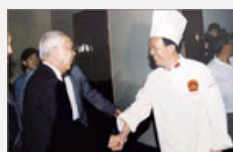
亲历者揭国宴改革 现只保留“三菜一汤”