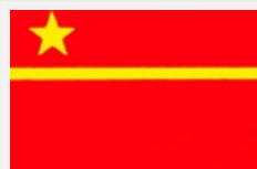
独家揭秘：差点成为国旗的设计稿什么样？