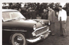
“红旗”车阅兵历程 林彪第一个乘坐检阅部队