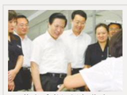
江苏省委书记梁保华在泗洪县考察