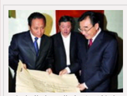
张庆黎在西藏自治区档案馆考察