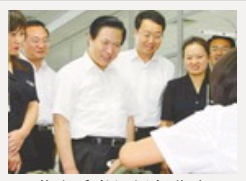
江苏省委书记梁保华在泗洪县考察