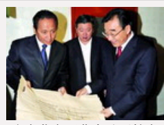
张庆黎在西藏自治区档案馆考察