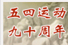
“五四运动”九十周年