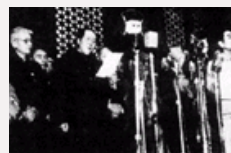
开国大典上的外国人