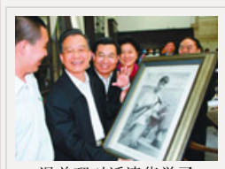
温总理对话清华学子