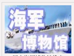
网上海军博物馆推出