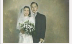
叶永烈: 钱学森未曾被授予过中将军衔(组图)