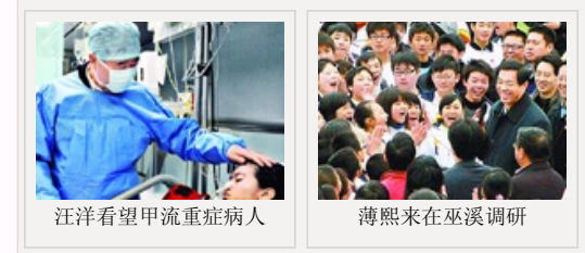
汪洋看望甲流重症病人 薄熙来在巫溪调研