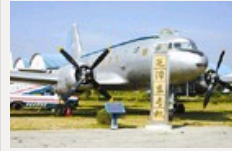
航空博物馆镇馆之宝: 毛泽东乘坐过23次的飞机