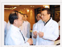
李克强考察甲流疫苗研发