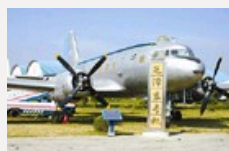
航空博物馆镇馆之宝：毛泽东乘坐过23次的飞机