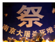
勿忘国耻圆梦中国