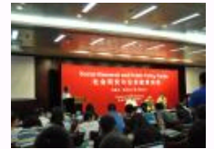
北大社会研究中心举办“社会研究与公共政策论坛”