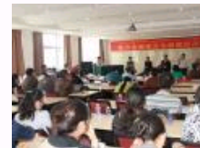
中央财经大学与西藏大学和北京大学联合举办“经济”