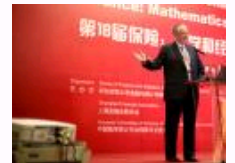
第18届“保险：数学和经济学”全球年会召开