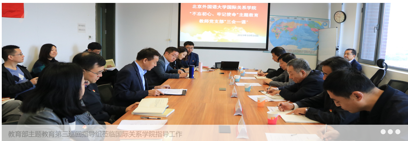
教育部主题教育第三巡回指导组莅临国际关系学院指导工作