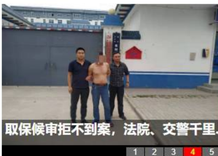
取保候审拒不到案,法院、交警千里...