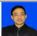
黄辉 院长 教授 博士