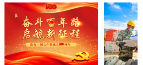
【专题】奋斗百年... 新疆喀什