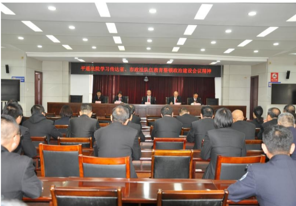
平遥县人民法院学习传达省、市政法队伍教育...