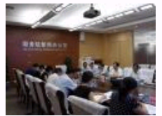
“国家人权教育与培训基地”工作汇报会在京举行