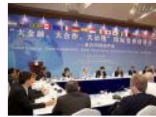
20国智库代表聚人大 议“大金融·大合作·大治