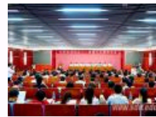
山东社科论坛城镇化发展研讨会在山大举行