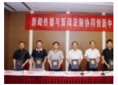
我国首家新闻传播与新闻法制协同创新中心成立