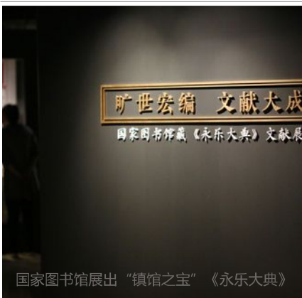
国家图书馆展出“镇馆之宝”《永乐大典》