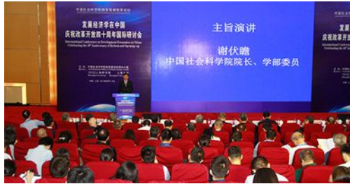
中国社会科学院国家高端智库论坛召开