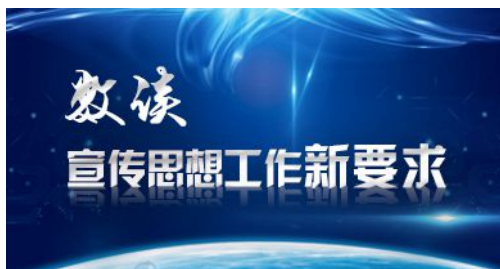
数读宣传思想工作新要求