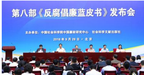
《中国反腐倡廉建设报告NO.8》在京发布