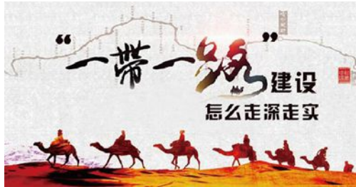
一带一路建设怎么走深走实