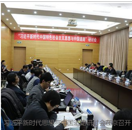
习近平新时代思想与中国道路研讨会在京召开