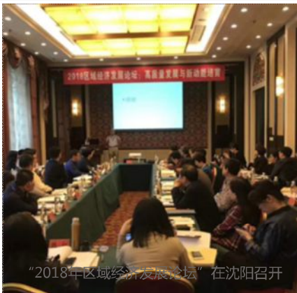
“2018年区域经济发展论坛”在沈阳召开