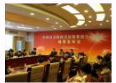
中国社会保障发展指数报告2012发布