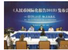
人民大学发布《人民币国际化报告2013》 解析世