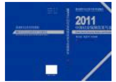
《2011年中国社会保障改革与发展报告》已出版