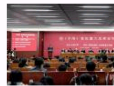
《子海》首批重大成果发布会在山大举行