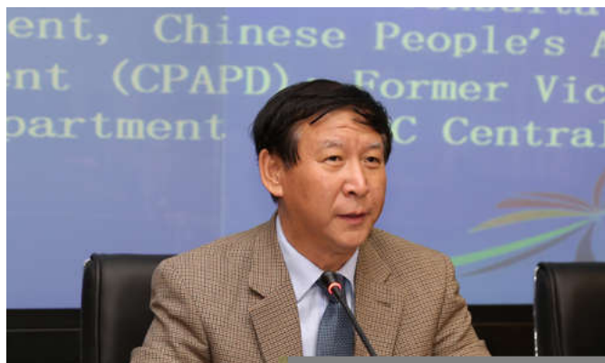
中共中央对外联络部原副部长于洪君为论坛开幕致辞并作主题发言