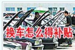
50亿鼓励汽车以旧换新