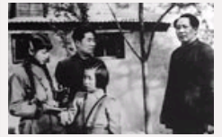
毛新宇在《求是》撰文怀念伯父毛岸英