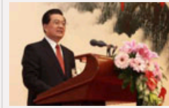
品读胡锦涛总书记“新年第一文”