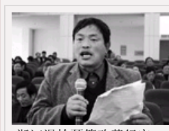
浙江温岭预算改革纪实: 监督政府花钱多了辩论声