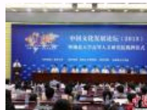
湖北成立高等人文研究院 研究当代中国主流文化