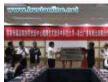
国家传播战略协同创新中心揭牌