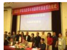
北京大学翁洪武学术创新研究基金签约仪式举行