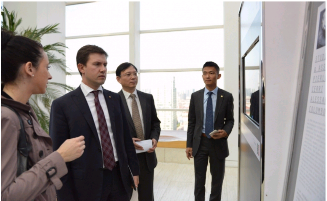
据悉，该展览展出了包括16家上海及华东地区意大利建筑设计所的最佳作品，将持续到11月28日。