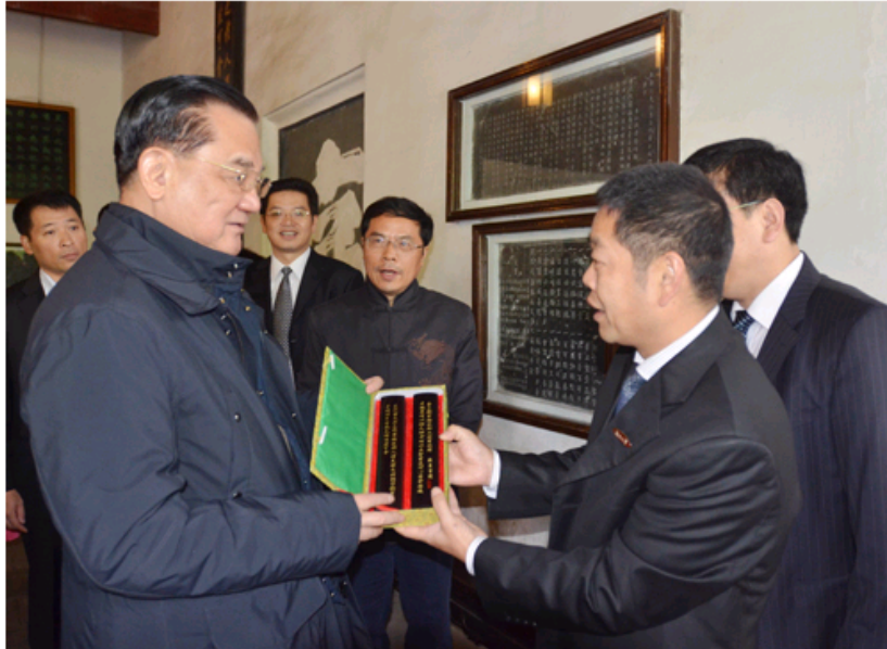
湖南大学党委副书记栾永玉向中国国民党荣誉主席连战赠送礼物