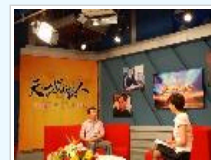
安徽电视台《天下安徽