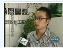
中央电视台新闻联播