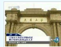
中央电视台新闻联播: