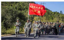
2018级军训团顺利完成野外拉练任务