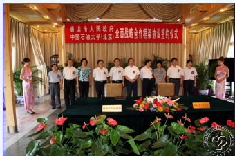
中国石油大学与唐山市签署全面战略合作框架协议