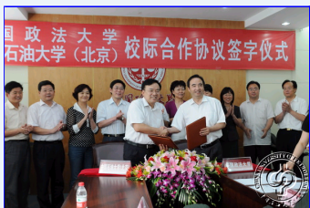
中国石油大学与中国政法大学签署校际合作协议