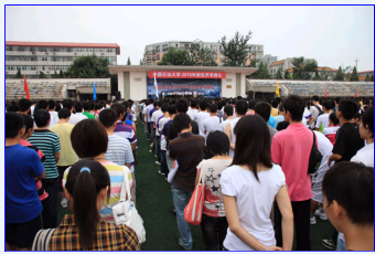
中国石油大学2010级新生开学典礼隆重举行