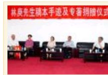
现代文学馆获捐赠