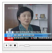
谷歌回应作协公开道歉