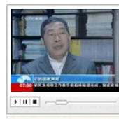
专家认为应先认定谷歌是否侵权