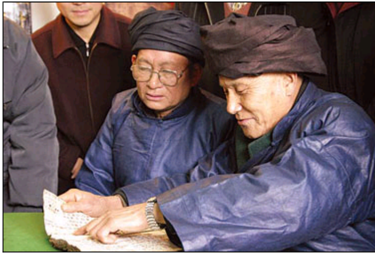
“水书先生”正在研读水书

水书和水族古文字就是这样代代相传。在传承过程中，有固守祖宗遗训的，稳固保留了大量古文字；也有为解决现实巫事活动中的难题而发展了不少的变异字。在现今的水族社会中，在立房造屋、接亲嫁女、丧葬祭典、出行农事、节日喜庆、消灾避邪时，水族群众依然以水书作为依据，以祈求安康、顺利和幸福。