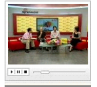
刘震云谈中法文学