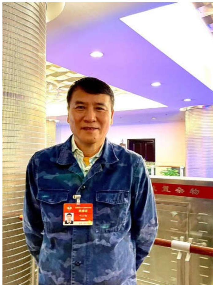
图为全国政协常委、中国文联副主席、中国音乐家协会主席叶小钢。