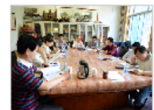
中国传统音乐学会