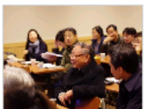
中国传统音乐教学