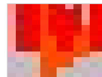
华南师范大学+美国…