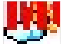
高考视障考生单招…