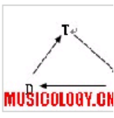
论小说《你别无选择》中的音乐性