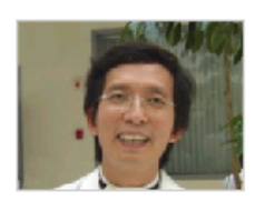
把音乐还给音乐教…