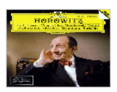
唱片封面上的视觉…